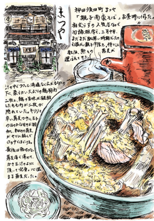
↑ 紹介例 2 神田・まつや