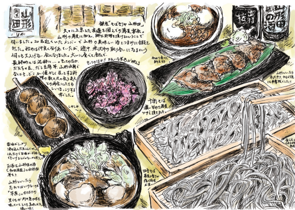
← 紹介例 3 銀座・山形田

神田・眠庵、虎ノ門・砂場総本店 並木藪そば、日暮里・川むら 両国・ほそ川 (ミシュラン星獲得) 神楽坂・蕎楽亭 (ミシュラン星獲得) 立石・玄庵、浅草・尾張屋 神田まつや、神田・松翁 銀座しまだ (俺の〜シリーズの元祖) など30店以上の名店が登場!